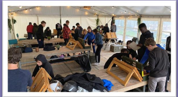
Foto: activiteitendag leerjaar 6

De nieuwe brugklassers kwamen half augustus op een woensdag met frisse moed naar school. Het moet voor velen onwennig hebben aangevoeld, in ons grote moderne gebouw, met al die nieuwe gezichten, ook al hadden we in juni al een kennismakingsmoment gehad. Gelukkig maakt onze glijbaan veel goed; daar doe je het als brugger dan ook voor natuurlijk. De eerste dag was gevuld met leuke kennismakingsspellen en veel geregeld van zaken als laptops instellen. Fijn dat we dit jaar extra tijd hadden met de klas en dat er weer enthousiaste